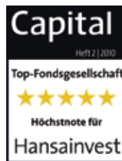
„Capital“-Siegel: Top-Note mit fünf Sternen.

Zwei Gütesiegel bescheinigen HANSAINVEST Höchstleistungen.