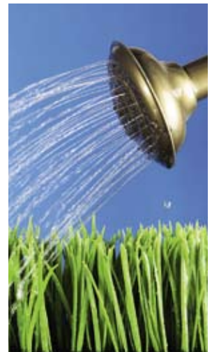
Gras: mit Sparplänen das Vermögen wachsen lassen.