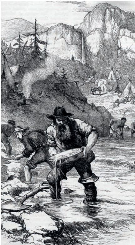
Suche nach Reichtum: Der Goldrausch in Kalifornien ließ Metropolen wie San Francisco entstehen.

Der Goldpreis hat in der jüngsten Vergangenheit laufend neue Hochs erklettert. Die Besinnung auf das geschichtsträchtige Edelmetall hat in Krisenzeiten Tradition.