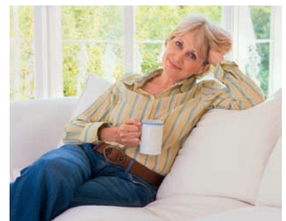
Anlegerin: vertraut auch in turbulenten Zeiten auf aktives Management.

>> Wer einen Teil seines Vermögens in Investmentfonds anlegen will, hat die Wahl zwischen zwei Sorten von Fonds: passiv und aktiv gemanagten. Während passiv gemanagte Fonds, die lediglich einen Börsenindex nachbilden, oft nur an wenigen Stichtagen im Jahr nach festen Regeln angepasst werden, können Manager von aktiven Fonds jederzeit die Zusammensetzung des Portfolios ändern. HANSAINVEST konzentriert sich auf Portfolios, die von professionellen Managern betreut werden mit dem Ziel, Anleger von der Erfahrung der Experten profitieren zu lassen. Das Konzept hat sich vor allem in den vergangenen Monaten bewährt, als die Griechenlandkrise viele Anleger verunsicherte. „Aktives Management ist in schwierigen Zeiten besonders wichtig, da die dynamische Gewichtung der Anlageklassen der entscheidende Beitrag zur