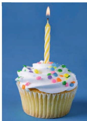
Grund zur Freude: Drei Fonds von HANSAINVEST haben Jubiläum.

HANSAzins wird 25, zwei Dachfonds werden jeweils zehn Jahre alt.