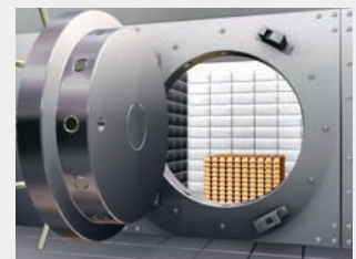
Gut verwahrt: Das meiste Gold lagert in der US-Notenbank.

Man weiß nie, was kommt. Deshalb wird Gold heutzutage als sichere Wertanlage für Krisenzeiten aufbewahrt – auch von Regierungen. Die Deutsche Bundesbank hält und verwaltet die Goldreserven der Bundesrepublik Deutschland. Sie sollen den Euro stabilisieren und das Vertrauen in die Gemeinschaftswährung stärken. Das größte Goldlager der Welt befindet sich übrigens nicht – wie viele Menschen glauben – im amerikanischen Fort Knox in Kentucky, sondern in einem Keller der US-Notenbank in New York. Dort lagert etwa ein Drittel der weltweiten Goldreserven, darunter ein Großteil des Goldes der Deutschen Bundesbank. Weitere Edelmetallvorräte der Bundesbank lagern bei den Notenbanken Großbritanniens und Frankreichs. In Frankfurt am Main, in den Tresoren der Bundesbank selbst, befinden sich angeblich nur rund zwei Prozent der deutschen Goldbestände. <<